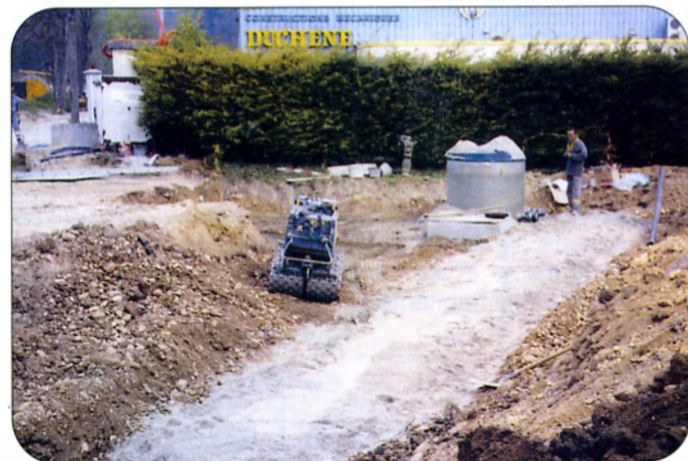
Station de relevage des eaux usées

Comme d'habitude, les travaux engendrent des nuisances et nous demandons aux riverains et aux usagers de s'armer de patience.